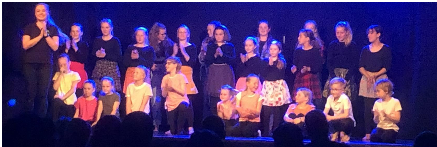
Fra danseforestillingen 3. juni.