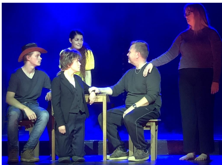
22. november var en av de siste øvingene til TGS