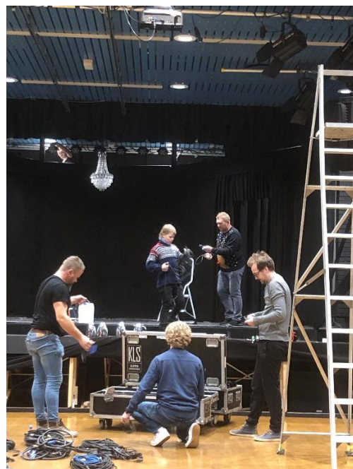
10. desember måtte vi pakke sammen.